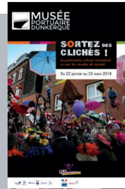
▼ Vue de l'exposition "Sortez des clichés !"

Cette exposition, résultat d'une enquête photographique et ethnographique coordonnée par la Fédération des écomusées et des musées de société (FEMS), illustre parfaitement la richesse et la diversité du patrimoine culturel immatériel en France. Le patrimoine immatériel c'est ces traditions ou expressions vivantes héritées de nos ancêtres et transmises à nos descendants (comme les traditions orales, les arts du spectacle, les pratiques sociales, rituels et événements festifs), ces connaissances et pratiques concernant la nature et l'univers ou les connaissances et le savoir-faire nécessaires à l'artisanat traditionnel.