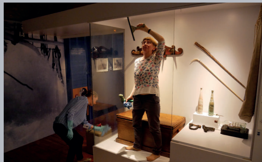
▲ Pendant la période de fermeture annuelle, l'équipe d'entretien est sur le pont pour rendre leur éclat aux vitrines.