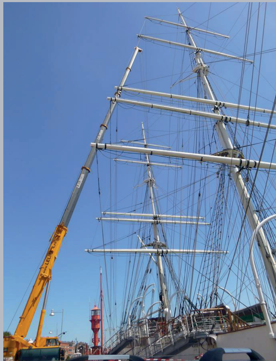
▲ Opération d'entretien des gréements par EVT.