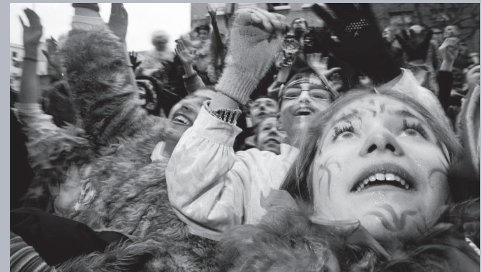
▲ Dimanche, le lancer de harengs Une photo prise pendant le carnaval de Dunkerque, l'un des 7 thèmes développés dans l'exposition.