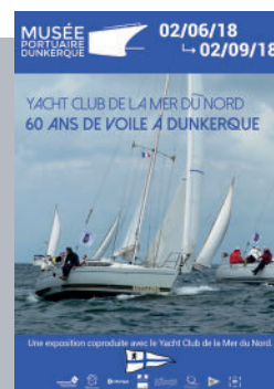
▼ Vue de l'exposition : "Yacht Club de la mer du Nord : 60 ans de voile à Dunkerque".

L'association Tèteghem'Art regroupe depuis 2008 une quinzaine d'artistes peintres régionaux. L'exposition qui s'est tenue au musée présentait une série de tableaux réalisés à partir de techniques différentes : huile, aquarelle ou pastel. Un thème commun les unissait : une balade portuaire au fil du temps. Les visiteurs ont ainsi pu découvrir différents aspects du port de Dunkerque allant du patrimoine architectural aux dernières technologies maritimes.