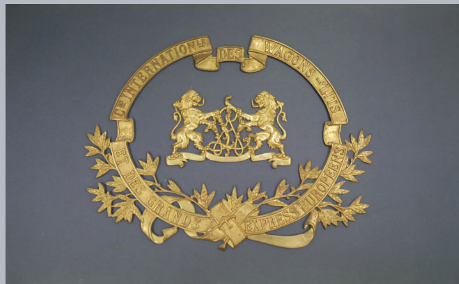
▲ Monogramme de la Compagnie Internationale des Wagons-Lits et des Grands Express Européens (don).