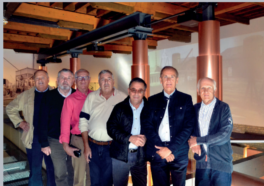
▲ Une partie du conseil d'administration des Amis du Musée portuaire.

117 cotisants payants au 31 décembre 2018 (auxquels s'ajoute l'ensemble des entreprises partenaires qui sont de fait membres des Amis du musée).