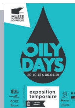
▼ Vue de l'exposition : "Oily Days" mettant en avant une partie des objets récupérés à l'issue de l'appel à collecte.

Cette exposition, très riche, abordait des thèmes très variés, de celui attendus de la pollution, des nouvelles énergies par exemple, mais aussi d'autres plus surprenants comme la recherche spatiale. Une manière de montrer que le pétrole est présent partout, bien plus largement répandu qu'on ne l'imagine. Un constat appuyé par la présentation d'objets «vintage», rappelant, comme le ferait un album de photos de famille, le quotidien des années 60-70. Ces derniers ont été recueillis auprès d'habitants du territoire qui ont généreusement répondu à notre appel à collecte.