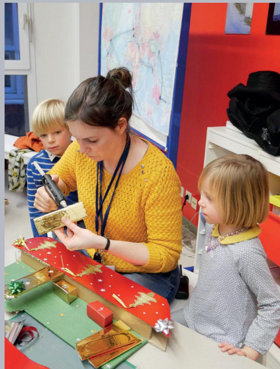
▲ Dans la nouvelle animation "Construis ton calendrier de l'avent The Box", les enfants fabriquent un porte-conteneurs à l'intérieur duquel les parents pourront glisser des friandises.

22 545 scolaires reçus au musée (de la maternelle au lycée) et 6 225 enfants en centres de loisirs