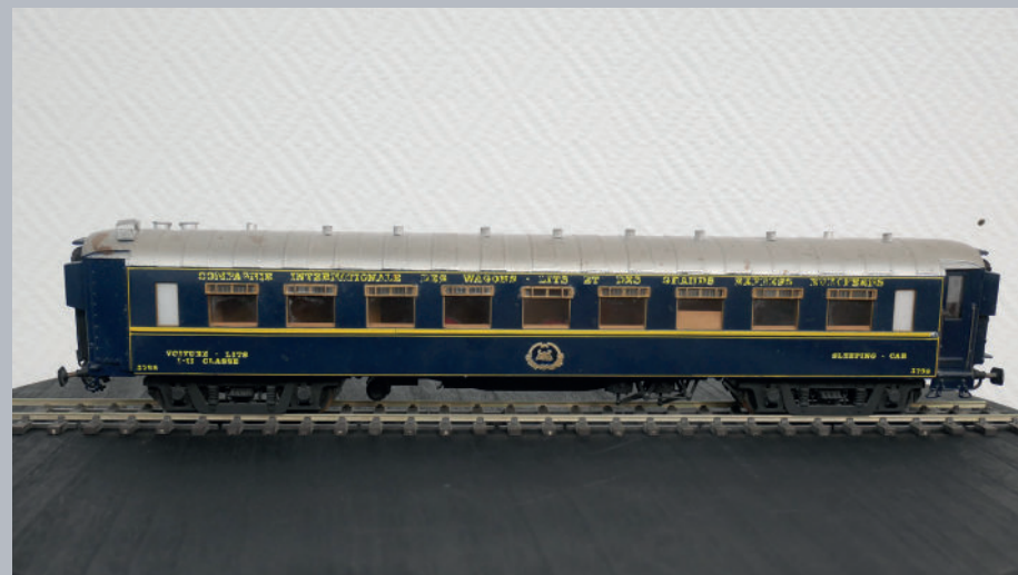
▲ Modèle réduit d'une voiture de la Compagnie Internationale des Wagons-lits et des Grands Express Européens (don).