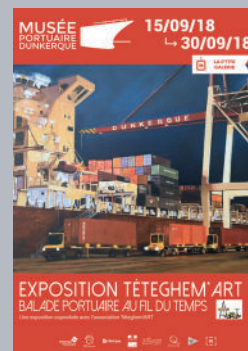
▼ Vernissage de l'exposition : "Balade portuaire au fil du temps" par Tèteghem'Art.