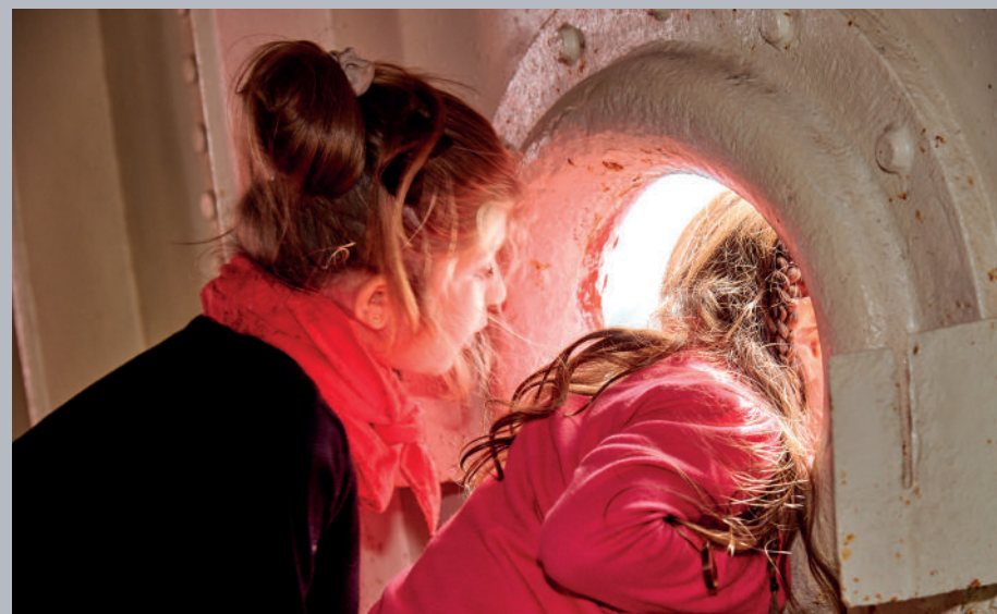
▲ Les Journées du Patrimoine sont une occasion parfaite de venir découvrir les secrets du musée en famille