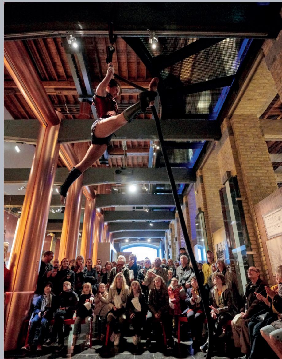
▲ Un public toujours plus nombreux vient profiter de spectacles de haute volée pour la Nuit Européennes des musées.

Nouvelles propositions de découverte sur le terrain du port à