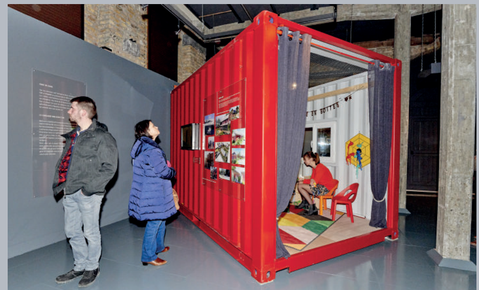
▲ Visiteurs au cœur de l'exposition The Box : à l'extérieur ou même dedans, les moyens de découvrir le conteneur sont multiples.