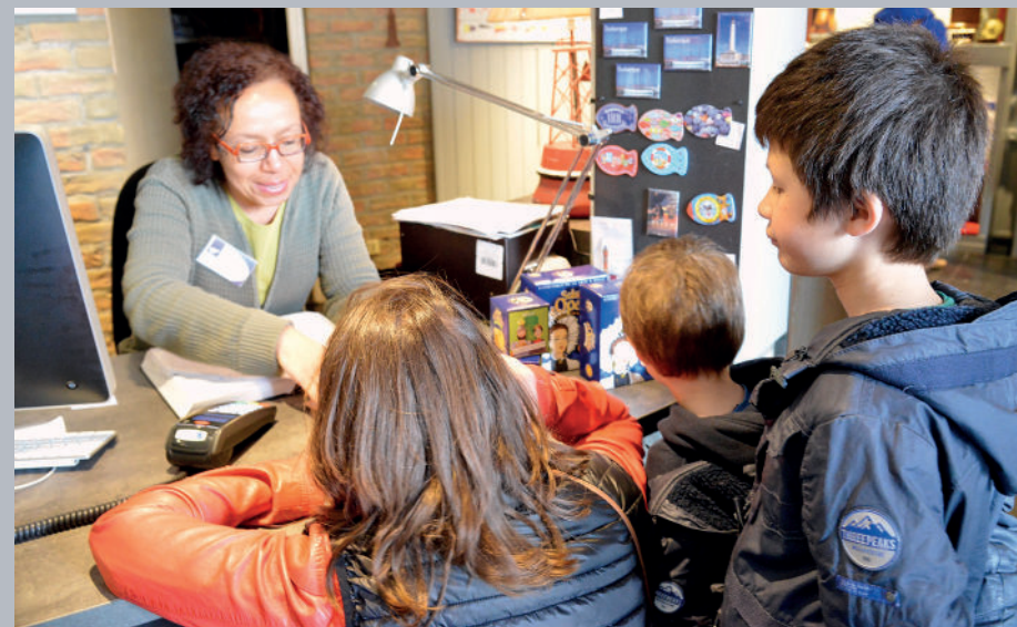
▲ L'équipe d'accueil, présente 347 jours par an, au service des visiteurs.