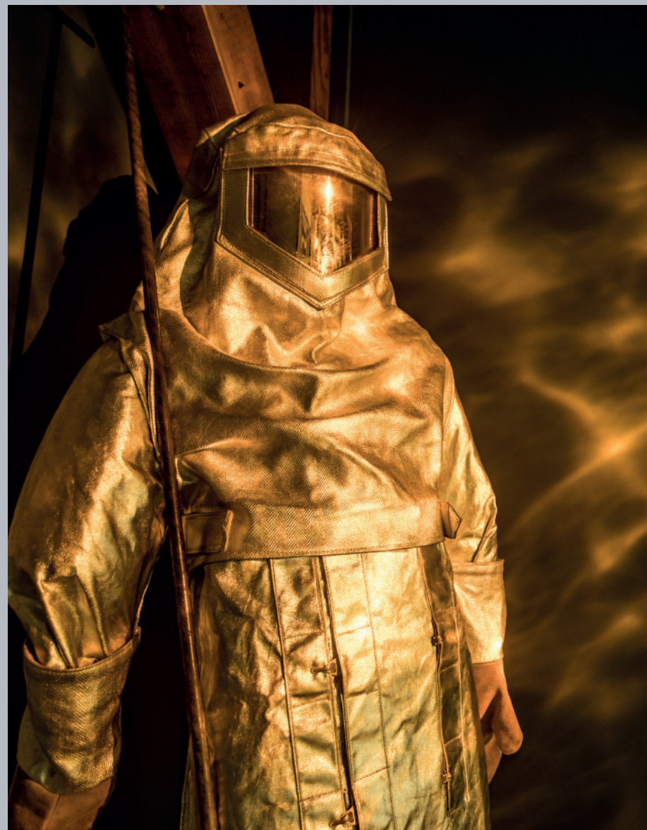
▲ Habit de fondeur d'ArcelorMittal, don du Musée de la Siderurgie de Grande-Synthe.

En effet, l'exposition s'est offert un joli lifting et a bénéficié