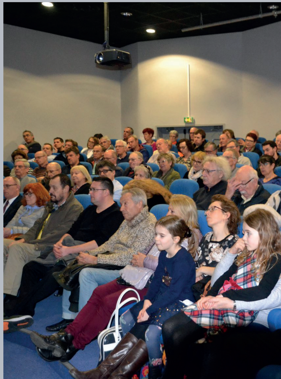
▲ Le public, nombreux, venu assister à une conférence organisée par les Amis du Musée portuaire.