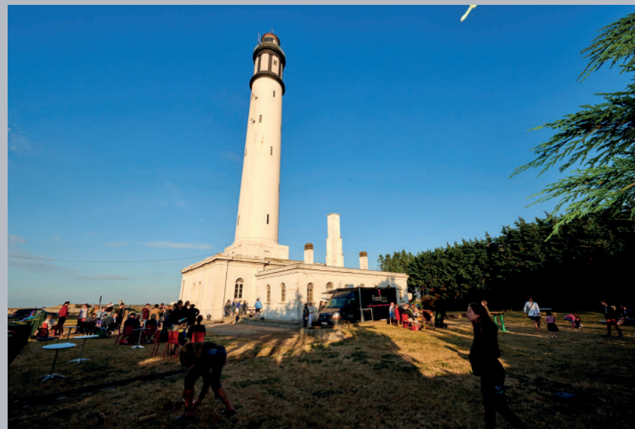
▲ Au programme de cette nouvelle édition de La Fête au phare : des visites, un food truck, des jeux traditionnels et même un concert.

Nouvelle animation proposée cette année, conçue en partenariat avec l'association Lézard Ludique.