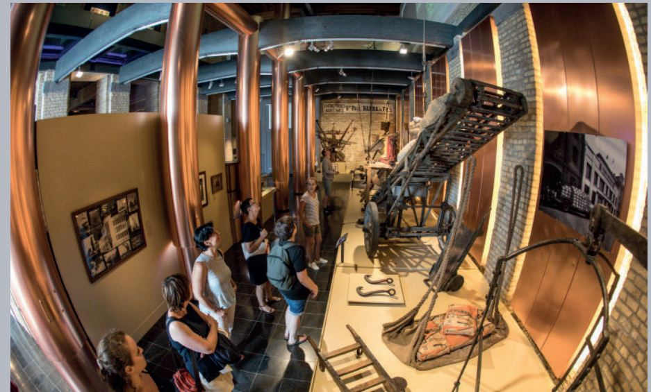
▲ Visiteurs dans la salle de maintenance du parcours permanent.

Enfin, dans les visiteurs provenant de notre région, 49 % sont des habitants du territoire de la CUD.