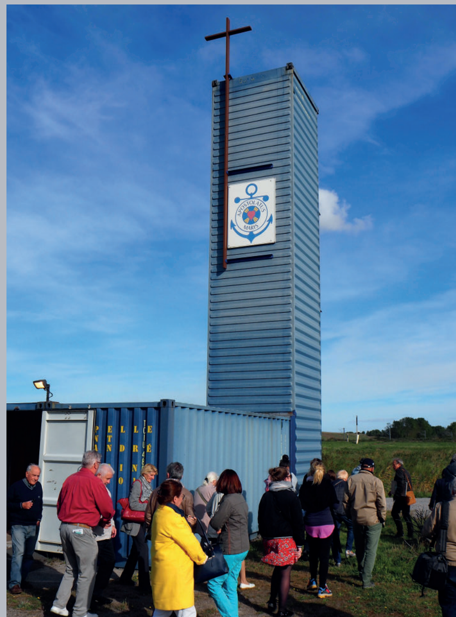
▲ Visite de la chapelle des marins de Loon-Plage.

Création de l'animation « Musée, mode d'emploi » et de l'animation « Noël à bord du bateau-feu »